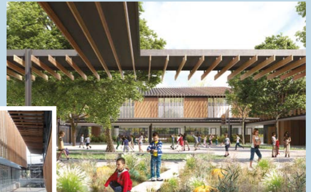
La cour de récréation ↗

↳ Les larges coursives donnant accès aux 16 salles de classes de l'école.