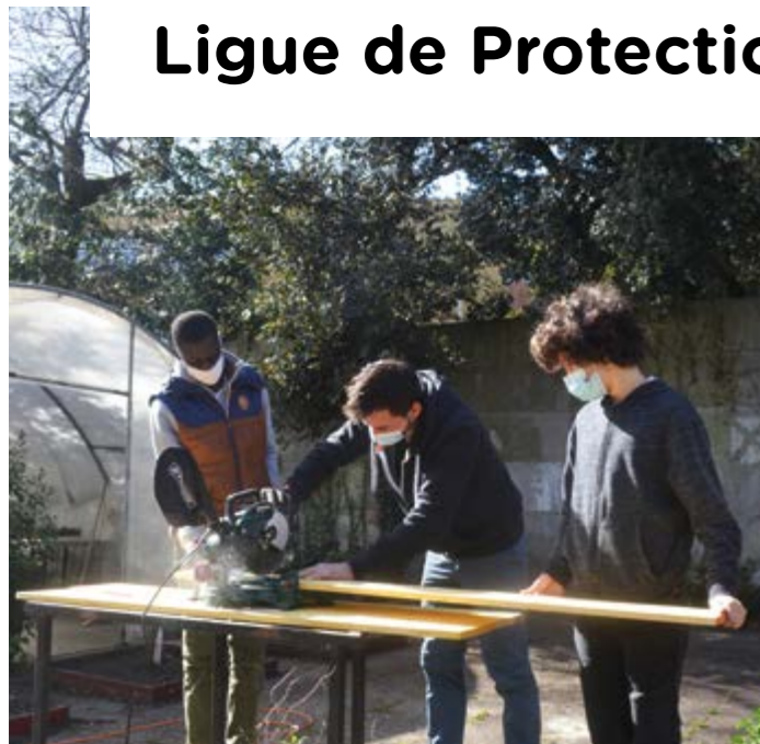
➤ Atelier «Oiseaux des Jardins», le 17 mars au Collège Ausone.