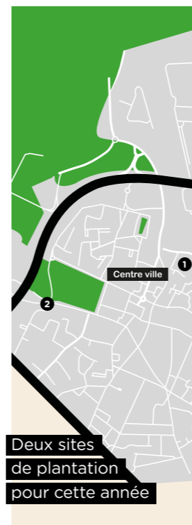
Deux sites de plantation pour cette année