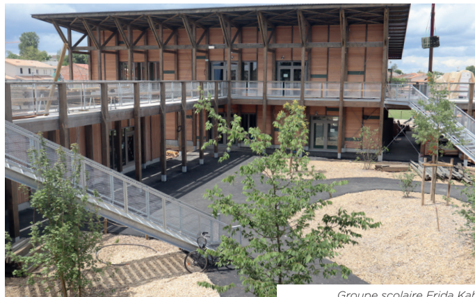
Groupe scolaire Frida Kahlo équipé d'une chaufferie biomasse.