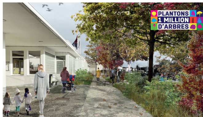
Projection des aménagements paysagers sur le parvis Sud du groupe scolaire La Marianne